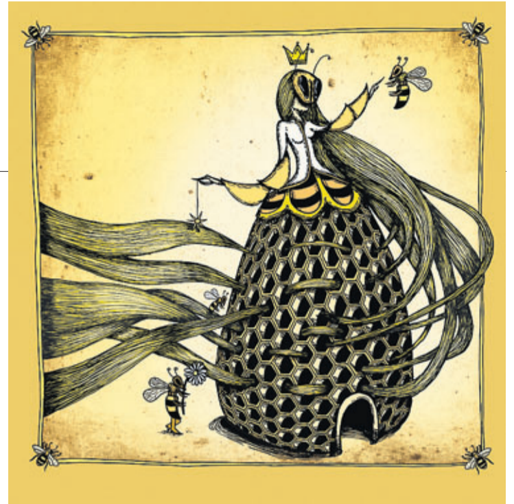
▶▶ La máquina para hacer rayos de sol funciona con un gran panel, del que salen líneas dulces y brillantes.